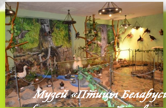
Музей «Птицы Беларуси и промышленное птицеводство»

Город Солигорск был основан в 1958 году в связи с открытием Старобинского месторождения калийных солей. За свою немноголетнюю историю город белорусских шахтёров превратился в один из самых крупных промышленных центров Беларуси. Каждая пятая тонна хлористого калия в мире добывается на солигорских рудниках