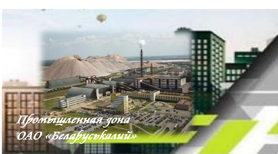
Промышленная зона ОАО «Беларуськалий»