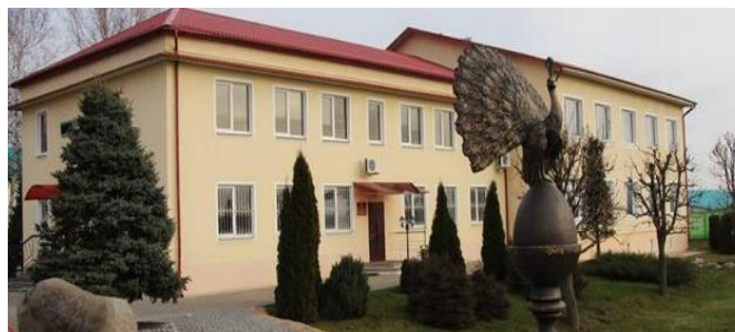
ОАО «Солигорская птицефабрика»