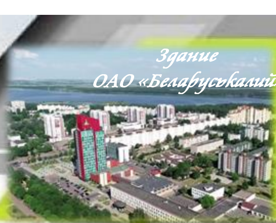
Здание ОАО «Беларуськалий»